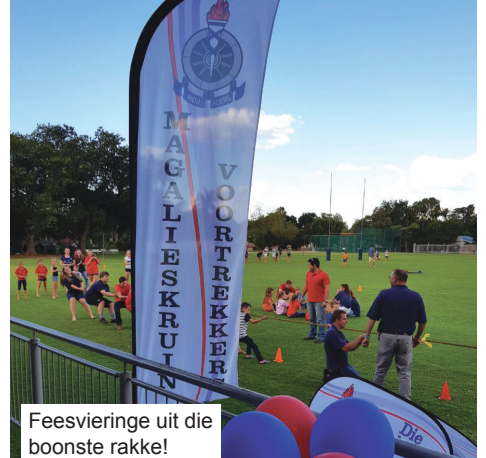
Feesvieringe uit die boonste rakke!